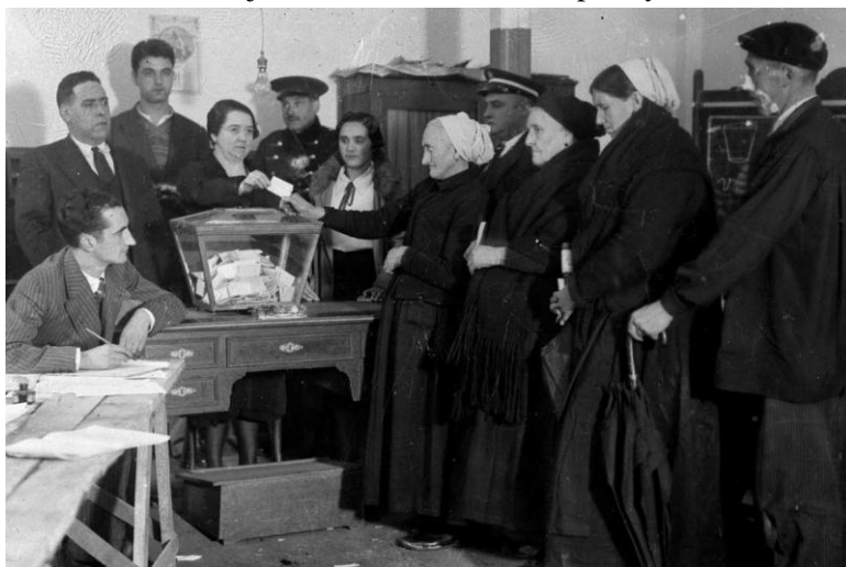
Referéndum autonómico del 5 de noviembre de 1933 en Éibar. La mujer vota por primera vez en España.

La idea de igualdad propuesta desde la época de la ilustración y va a incidir también en el caso de hombres y mujeres. En un modelo de sociedad patriarcal la mujer siempre había estado en un segundo plano pero desde el siglo XVIII se irá demandando la igualdad con el hombre hasta que a finales del siglo XIX se consolide como movimiento reclamando el derecho a voto en Europa Occidental y en EE. UU. Sobre todo se trata de mujeres de clase media-alta pero fue progresando con el desarrollo de la educación obligatoria en estos países hasta que en el primer tercio del siglo XX se otorgó el derecho al voto a la mujer en varios estados europeos y EE. UU.