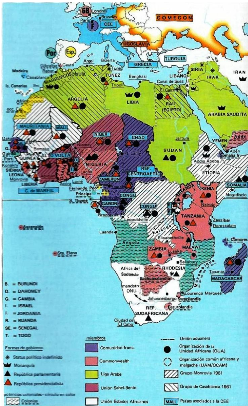
Africa en 1965